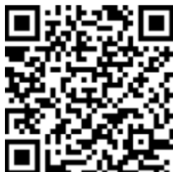
QR Code สำหรับรายงานประจำปีของบริษัทฯ (56-1 One Report)

สำหรับรอบปีบัญชีสิ้นสุด ณ วันที่ 31 ธันวาคม 2568